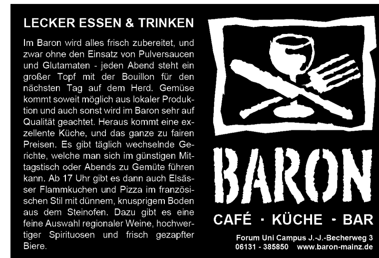
Illustration Hendrik Schneider